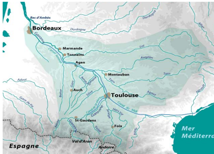
Le bassin hydrographique de la Garonne