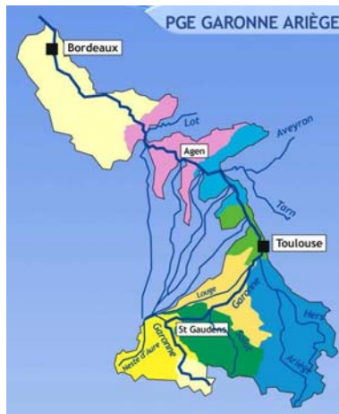
Le périmètre du PGE Garonne Ariège