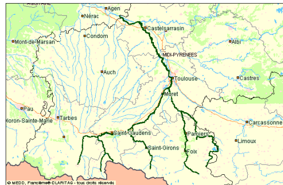
Le site Natura 2000 de la Garonne en Midi-Pyrénées (= aire d'intervention amont du programme de restauration des poissons migrateurs)