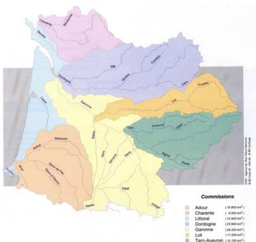
Les périmètres des commissions territoriales du comité de bassin Adour-Garonne