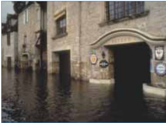
Ils contribuent à la sécurité publique : EPTB de la Seine.