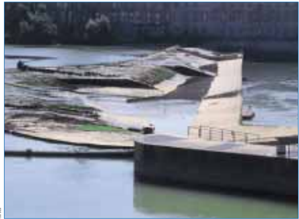
Ils contribuent à maintenir des débits suffisants en été : l'EPTB Garonne et le soutien des étiages.

Ils sont au centre des débats publics sur le partage de l'eau : Plan de Gestion des Étiages (PGE) Adour. Ils interviennent comme animateur ou médiateur pour apporter des solutions constructives dans des contextes conflictuels : les éclusées.