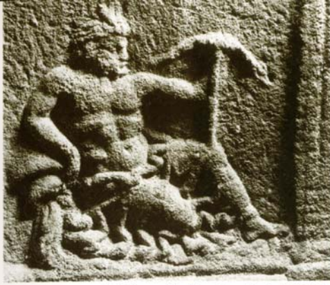
5. La Garonne Dieu fleuve. Face latérale de l'hôtel de M. Aurélius Lunarès (237 après J.-C., Bordeaux).