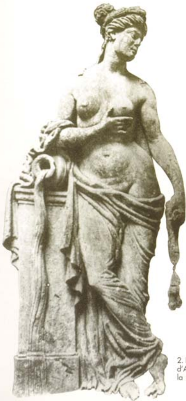
2. Bas-relief du musée d'Agen, représentant la Garonne.

ROI TOUT-PUISSANT, par tiers homme, ange et diable, Droit, sous le dais, d'un souffle formidable Faisant trembler la cristalline tour, – Le fleuve-dieu, Garon, tenait sa cour.