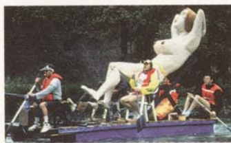
4. Garona 1992, La sirène.